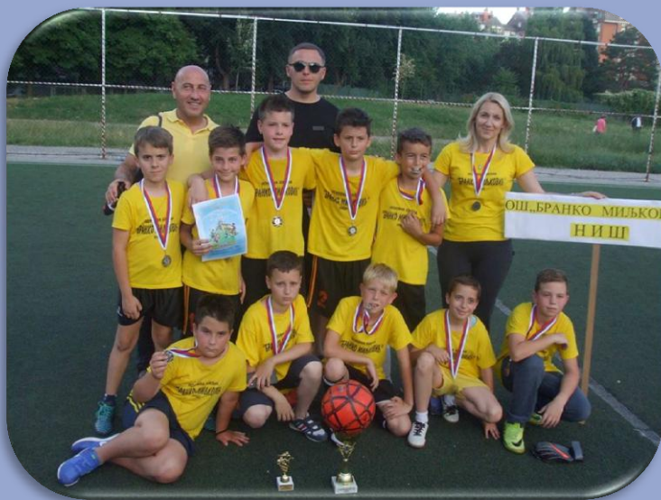
1. место на Мајском турниру

25. маја екипа ученика 4. разреда освојила је 1. место на Мајском турниру у малом фудбалу који организује Спортски савез и Учитељско друштво Ниш.