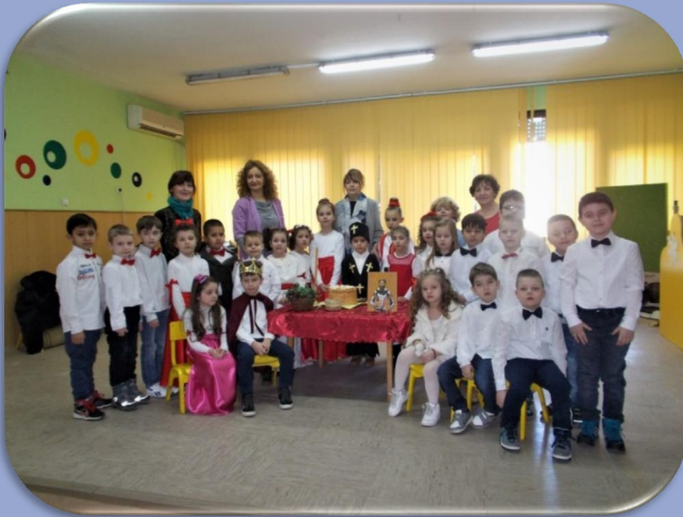
„Ускликнимо с љубављу светитељу Сави“

26. јануара, по трећи пут у овој школској години реализована је сарадња предшколске установе „Пепељуга“ и наше школе. У име школе, библиотекар је присуствовао приредби „Ускликнимо с љубављу светитељу Сави“.