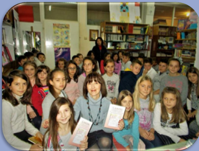
„Ланин чудесни свет“ и ми у њему