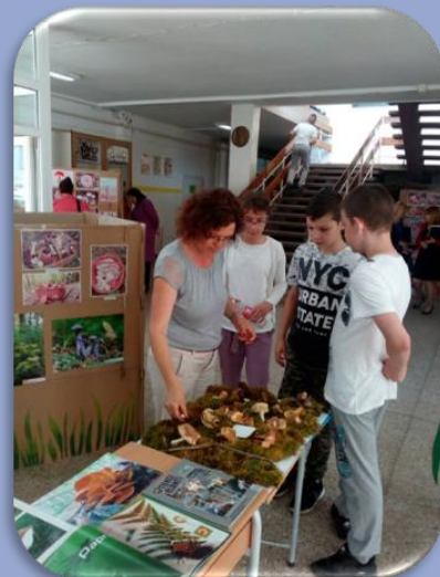
„Изложба гљива на сликама“