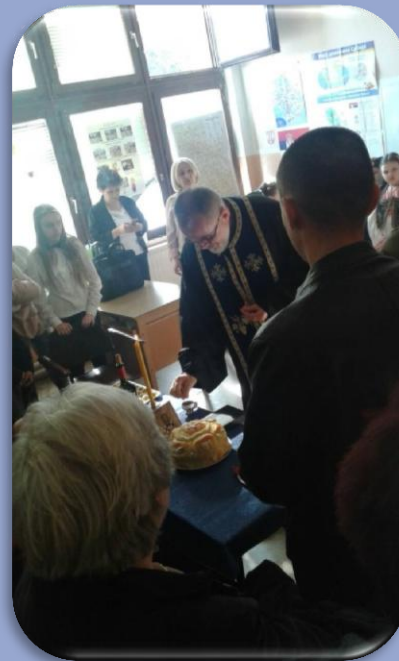
Школска слава Свети Сава у Сувом Долу ( 27. јануар 2018.)

29. јануара, на дан рођења Бранка Миљковића, у знак сећања на овог песника чије име наша школа једина у Србији носи, по седми пут расписан је наградни литерарни конкурс за песму под називом „Бранково перо“. На конкурс су могли да учествују ученици основних школа подељени у две категорије: