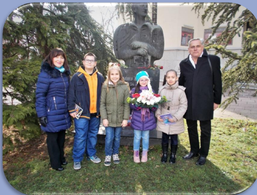
„Мене нема, али има љубави моје“.