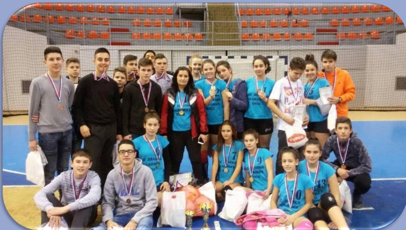
Светосавски турнир, одбојкаши наше школе 3. место