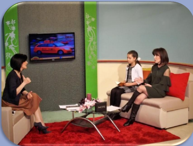
Ми славио Бранка

6. фебруара Књижевни клуб школе „Ватра и живот“ гостовао је на TV Zona Plus и говорио о конкурсу „Бранково перо“, књизи и читању.