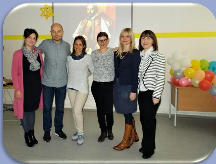
„Да ли би Његош имао инстаграм?“

6. децембара библиотекар школе организује предавање о Његошу „Да ли би Његош имао инстаграм?“ за ученике од 5. до 8. разреда. Предавач проф. књижевности Милица Вучковић.